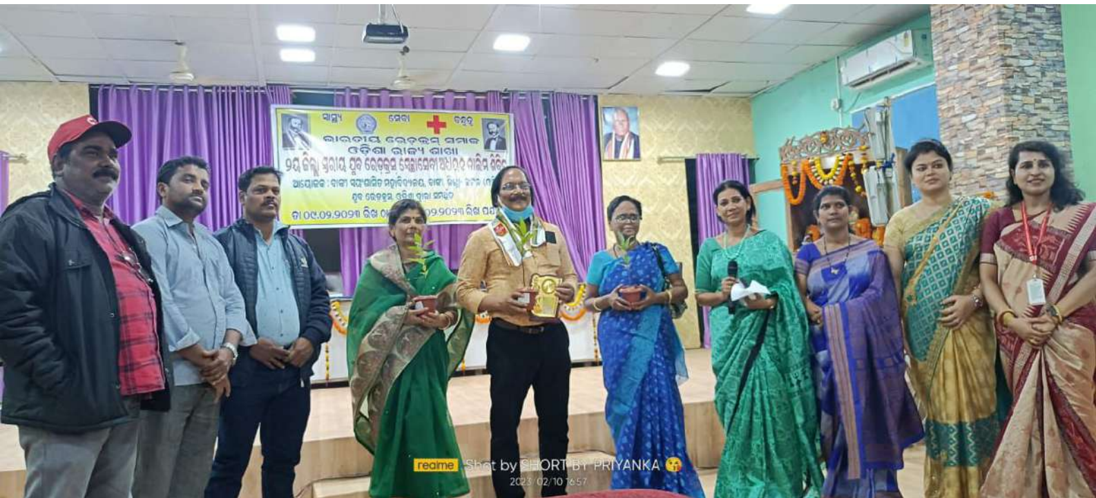
reame 2023/02/10 16:57