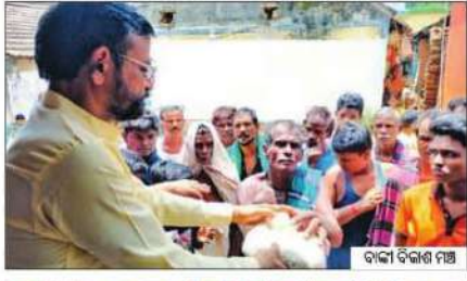
ବାଙ୍କୀ ବିକାଶ ମଞ୍ଚ